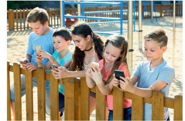
Kinder und Medien ... im Fluss der Zeit

Kooperation mit den Musikhochschulen Hannover, München und Trossingen