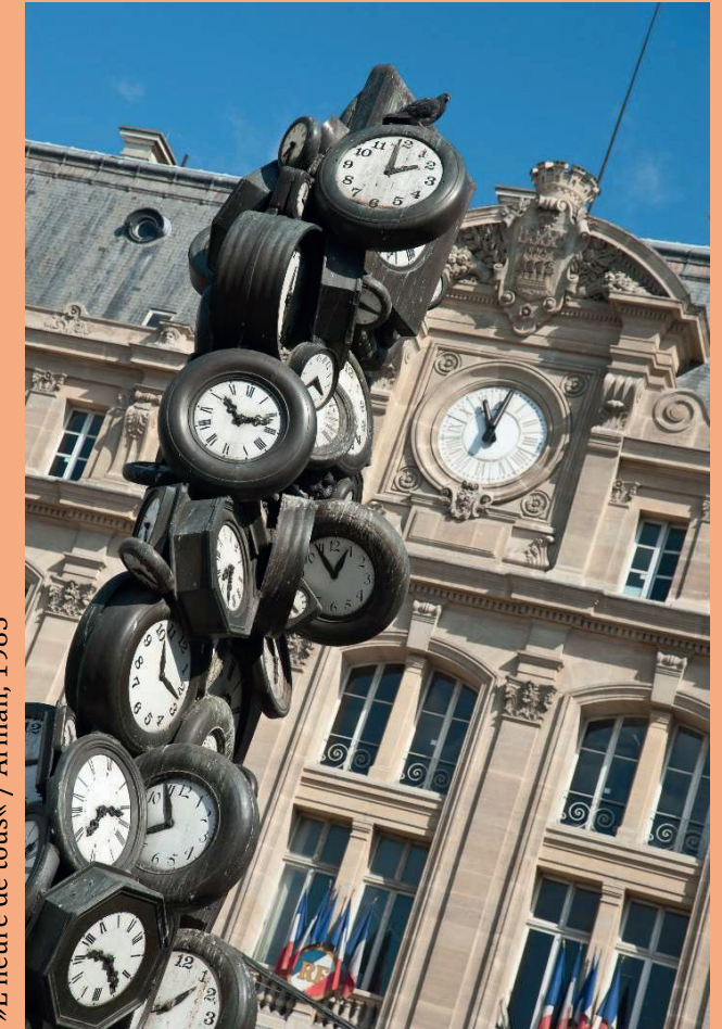
»L'heure de tous« / Arman, 1985

Eine Ringvorlesung zu einer der wichtigsten menschlichen Ressourcen