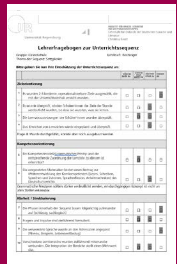
Abb. 2: Reflexionsbogen