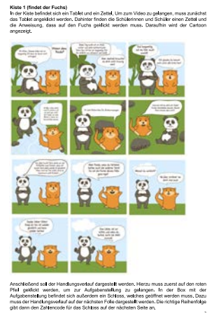
Abb. 1: Auszug aus einer Handreichung