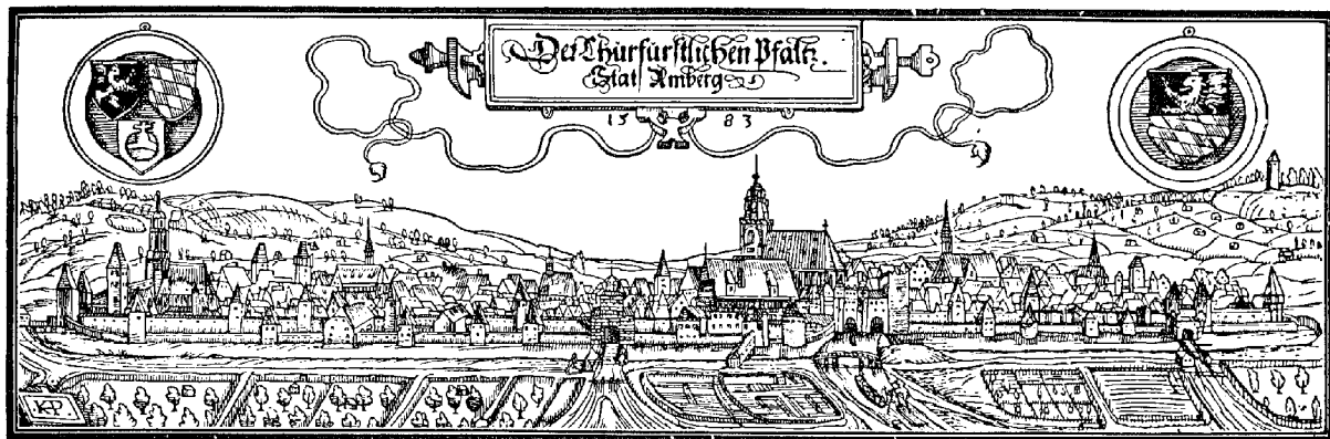
Ansicht der Stadt Amberg aus dem Jahre 1583