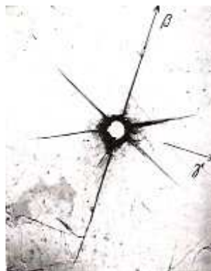
Abbildung pl.1: Schlagfigur auf einem Glimmerblatt

\lambda/4 - und \lambda/2 - Plättchen beruhen ebenfalls auf dem Prinzip der Doppelbrechung. Die Phasendifferenz der Verzögerungsplatten wird durch den Laufzeitunterschied zwischen den aufgespaltenen Strahlen aufgrund der unterschiedlichen Ausbreitungsgeschwindigkeiten erreicht. Für physikalische Zwecke verwendet man aus der Gruppe optisch zweiachsiger Kristalle oft Spaltstücke aus klarem Glimmer. Glimmerplättchen haben mechanisch ausgezeichnete Richtungen. Legt man die Platte auf eine Schreibunterlage und sticht mit einer Stecknadel ein Loch in die Platte so entsteht eine „Schlagfigur“ (siehe Abb. pl.1). Sie besteht aus einem sechsstrahligen Stern mit zwei langen Armen. Diese zeigen die \beta - Richtung an. Die auf ihr senkrechte Plattenrichtung ist die \gamma -Richtung. Die beiden bei der Doppelbrechung entstehenden Strahlen schwingen parallel zur \beta - Richtung (das im Kristall schnellere) und zur \gamma - Richtung (das im Kristall langsamere).