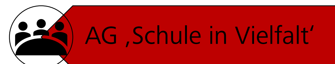
Drei Säulen des Projekts Impuls+