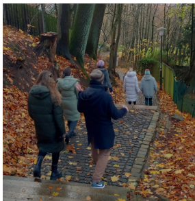
Gemeinsame Pause während eines Schreibretreats

Für Mitglieder werden zwei Mal im Jahr Schreibretreats organisiert. Teilnehmende können hierbei ein paar Tage in vollkommener Ruhe und Abgeschiedenheit an der eigenen Dissertation arbeiten, sich morgens und abends gemeinsam über Vorhaben und Fortschritte austauschen und von einem konzentrierten Arbeitsumfeld profitieren. Zusätzlich gibt es in den Semesterferien gemeinsame Schreib-Sprints an der Universität, die ebenfalls das Ziel verfolgen durch gemeinsames Arbeiten in einen Schreibfluss zu kommen.