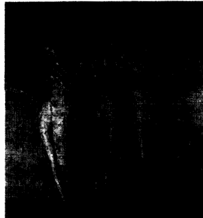
Die drei Grazien (1. Jh. n. Chr.), Fresko, Pompeji, Museo Archeologico Nazionale, Neapel

1 salve, puella fingierte Anrede – nasus, -i Nase – 2 bellus, -a, -um schön, hübsch → LW – pes, pedis m Fuß → LW – niger, -gra, -grum schwarz, dunkel → LW – ocellus, -i Diminutiv zu oculus, -i Äuglein – 3 longus, -a, -um hier schlank, zart – digitus, -i Finger → LW – os, oris n Mund → LW – siccus, -a, -um trocken → LW – 4 nec sane übersetze und gewiss ebenso wenig – 5 decoctor, -oris m eigtl. einer, der alles verkocht Pleitegeier – Formianus, -a, -um aus Formiae; Stadt nahe Rom – 6 ten ~ te-ne – 8 saeculum, -i ~ saeculum, -i Menschenalter, Generation → LW – insapiens, -ntis geistlos – infacetus, -a, -um geschmacklos