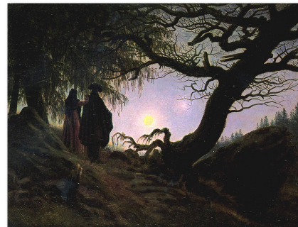
Abbildung 2: Gemälde einer Naturbetrachtung bei Caspar David Friedrich in Mann und Frau den Mond betrachtend (1818–1824).

Stills aus Filmen werden im Kurz- und Vollbeleg nach Punkt 2.4.9 zitiert.