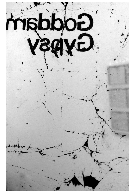
Daniel Baker, „Mirrored Books“, GB 2008 – 10, Tafel aus einer Serie von 50, Emaille und Blattsilber auf Perspex, Maße variabel

Was denken Roma und Sinti über ihre Rolle in den europäischen Gesellschaften? Was erzählen sie in ihrer Kunst und Literatur über sich, ihre Kultur und ihre Identität? Eine junge Generation von Wissenschaftlern, Künstlern und Aktivisten, Roma und Sinti führen einen selbstbewussten Diskurs über Emanzipation, Identität und Differenz, der unter anderem 2007 in die Organisation des ersten Roma-Pavillons auf der Biennale in Venedig mündete. Diesem Diskurs will das Symposium eine weitere Bühne bieten, denn Respekt und Dialog sind grundlegende Bestandteile der Demokratie. Die demokratische Verfasstheit Europas wird sich nicht zuletzt an der Politik gegenüber ihren Minderheiten messen lassen müssen.