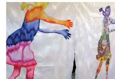
Delaine Le Bas, „Witch Hunt“, 2009 – 2011, Installation, Detail

Für die Teilnahme am Symposium ist eine Anmeldung erforderlich.