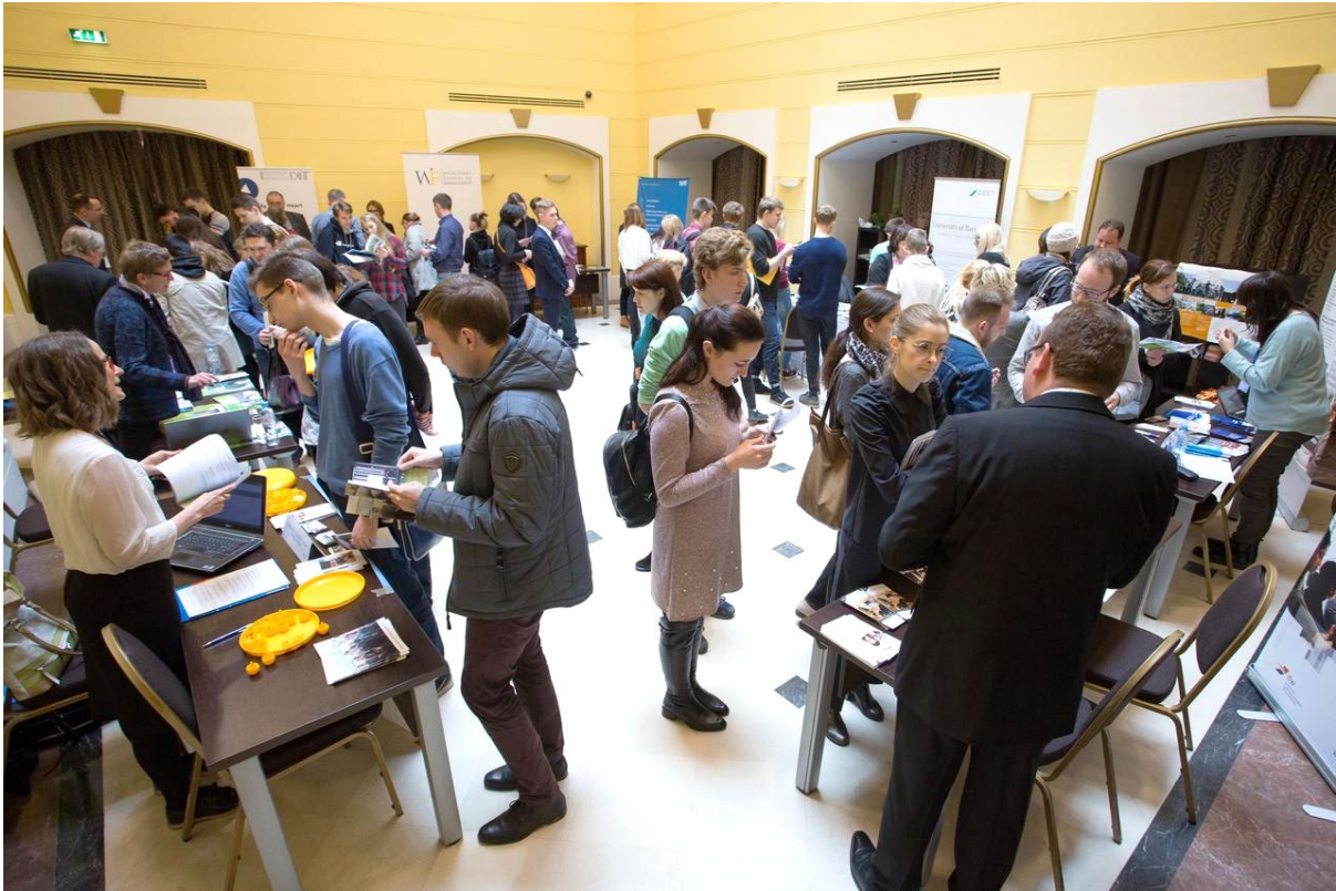
Großes Interesse an einem Studium in Bayern.

Ein weiterer Programmpunkt der Deutschen Woche war der Vortrag „Öffentlicher Raum – Vom 3-D-Modell zum Entwurf“ von der Hochschule Weihenstephan-Triesdorf und der Staatlichen Forsttechnischen S.M. Kirow-Universität Sankt Petersburg. Studierende der Landschaftsarchitektur arbeiten gemeinsam an einem Konzept zur Revitalisierung des Poleshajewski-Parks in Sankt Petersburg. Dieses Projekt wurde u.a. von BAYHOST gefördert. Bei der Projektvorstellung im Rahmen der Deutschen Woche wurde auch gleich ein Einblick in modernste Techniken gegeben und ad hoc ein Teil des Universitätsgartens gescannt.