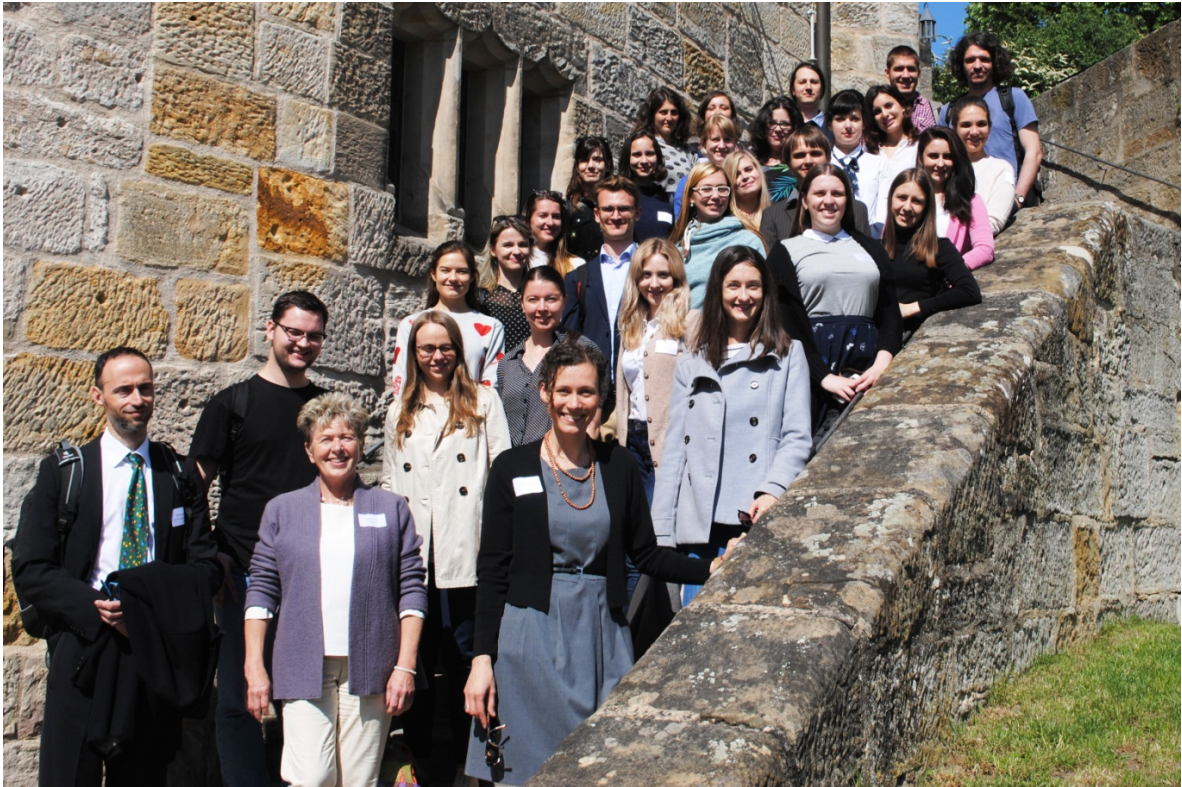
BAYHOST und seine Stipendiatinnen und Stipendiaten vor der Veste Coburg.