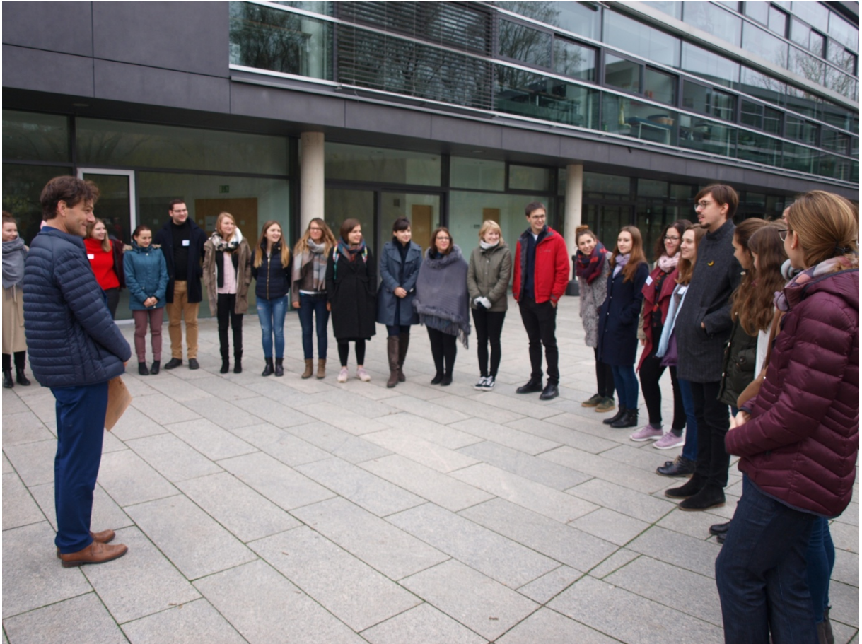
Workshop Prof. Barmeyer.