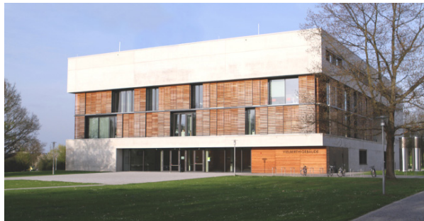
Das Vielberth-Gebäude am Campus der UR.

Die Universität Regensburg ist mit über 21.000 Studierenden eine innovative Campus-Universität. Sie will ihre Studierenden auf hohem Niveau wissenschaftsorientiert und forschungsbasiert bilden und sie auf ihre berufliche und persönliche Zukunft bestmöglich vorbereiten. Die Universität befindet sich in einer attraktiven Stadt an der Donau mit über 150.000 Einwohnern. Seit Juli 2006 trägt Regensburg den Weltkulturerbe-Titel der UNESCO. Dieser Titel würdigt den einzigartigen Charakter der mittelalterlichen Altstadt und ihrer herausragenden Bauwerke.