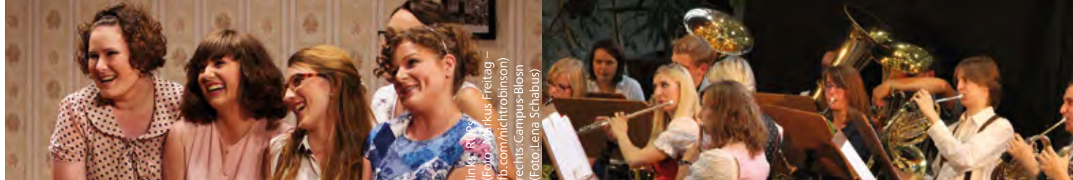
links: RUPs rechts: Campus-Blosn

Eine Initiative von Studentenwerk Niederbayern/Oberpfalz und Universität Regensburg