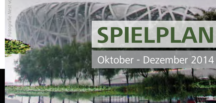
Fotografie Nest von Lena Schabus